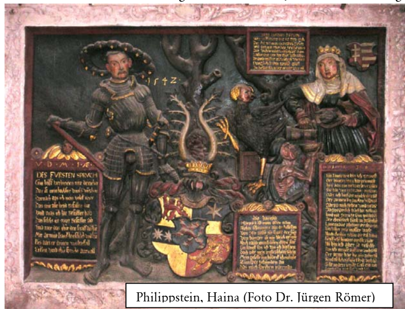
Philippstein, Haina

wieder in den evangelischen Kirchen. Der Protestantismus der Romantik nimmt die neue Identifikationsfigur allerdings begierig auf, stilisiert sie in die Rolle des Opfers des zunehmend dämonisierten Konrad von Marburg hinein und macht aus ihr die schweigende Dulderin, ganz dem bürgerlichen Frauenbild der Biedermeierzeit entsprechend. Die katholische Kirche folgt ihr darin durchaus, wie die berühmte und äußerst einflussreiche Elisabethbiografie des Comte de Montalembert zeigt.