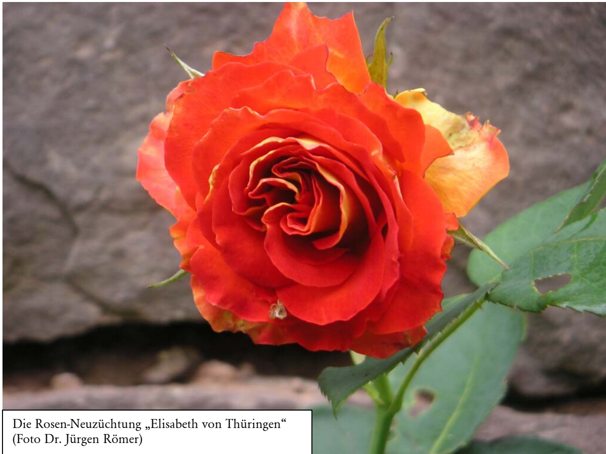
Die Rosen-Neuzüchtung „Elisabeth von Thüringen“