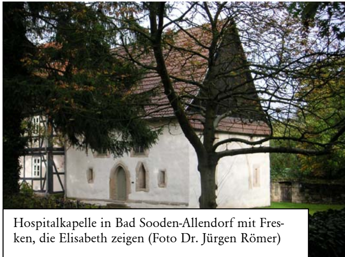
Hospitalkapelle in Bad Sooden-Allendorf mit Fresken, die Elisabeth zeigen

Die Nachricht von ihrem Tod verbreitet sich in Windeseile. Innerhalb weniger Stunden umringen viele Menschen den Leichnam, schneiden Fetzen von der Kleidung, reißen Haarbüschel aus und schrecken