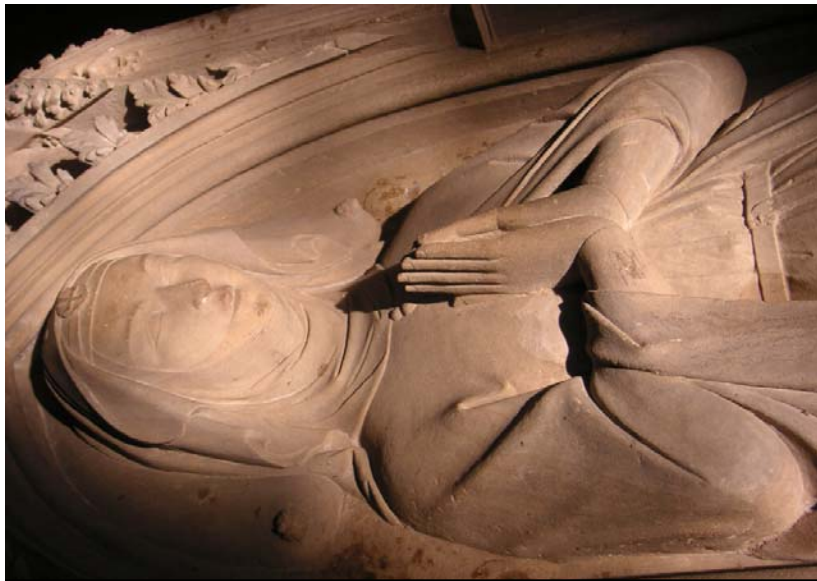
Grabtumba Gertruds in Altenberg an der Lahn

Dass Elisabeth ihre Kinder verließ, wird ihr heute noch – oftmals mit echter Empörung – zum Vorwurf gemacht. Dabei urteilen wir aber von heute aus. Die bürgerliche Kleinfamilie mit der uns vertrauten Rolleneinteilung setzte sich erst im 19. Jahrhundert, im hohen europäischen Adel sogar erst im 20. Jahrhundert durch. Keine Dame von hohem Stand zog im Mittelalter ihre Kinder selbst auf. Elisabeth wollte sich anderen Menschen hingeben. Für ihre kleinen Kinder war dabei kein Platz. Damit vollzieht sie nur in radikalster Konsequenz, was die Bibel ihrem Verständnis nach von ihr forderte. Es heißt dort, dass wir alles aufgeben sollen, um Christus nachfolgen zu können. Zudem wusste sie, dass ihre Kinder