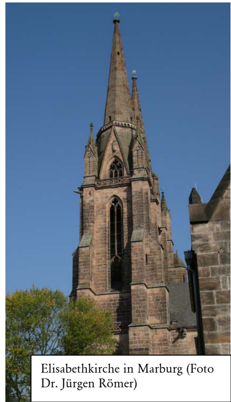
Elisabethkirche in Marburg

Das hört sich beinahe wie ein Programm für Elisabeths Arbeit in Marburg an und zeigt, wie sehr sie in die religiösen Strömungen der Zeit eingebunden ist. Leiden in der Nachfolge Christi wird – kurz gesagt – diesem Ideal zufolge eben nach dem Tod belohnt, und deswegen haben diese Menschen ein so ganz anderes Verhältnis zum Leiden als wir.