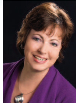
Krankenhausdirektorin und Botschafterin für Gesundheit