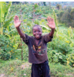
Ein Ticket für Afrika, Benefizkonzert im Theater im Park (Seite 13)