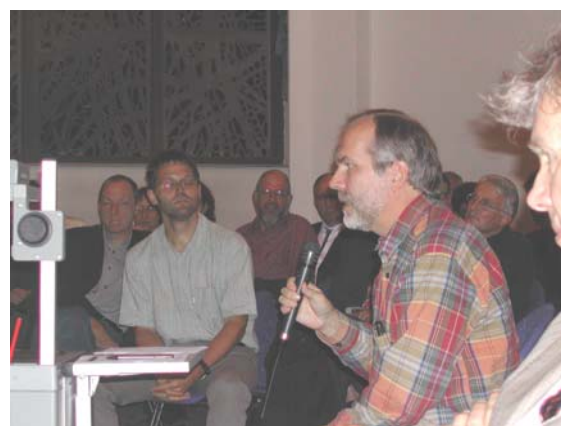
Fragen aus dem Publikum

Herbst, aber das hätte noch eine gute Stunde länger gedauert. Trotzdem scheint sich ein weiteres Thema gefunden zu haben: Die Bedeutung des Gebetes in der Seelsorge. Vielleicht ein anderes Mal?